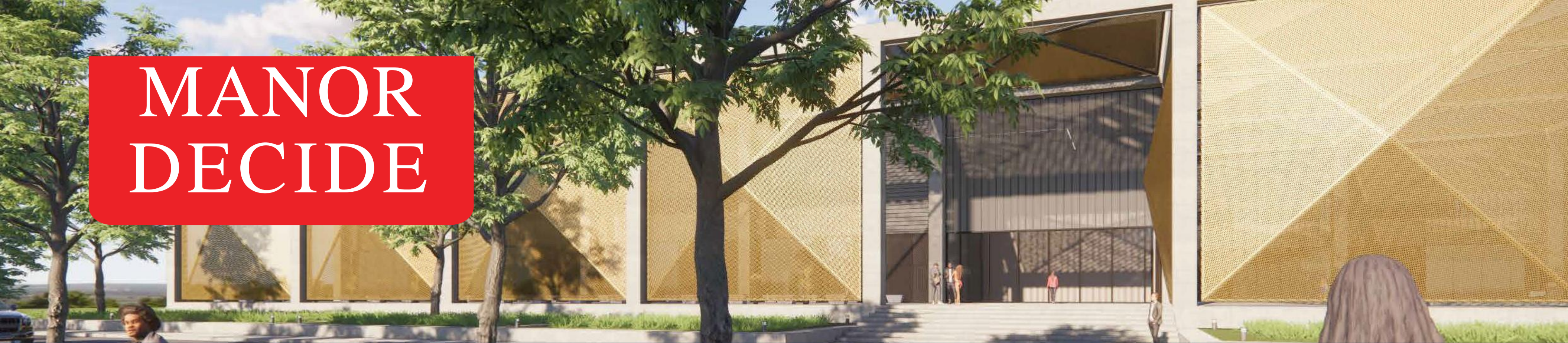
RECREATION CENTER – ENTRY